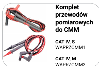
Komplet przewodów pomiarowych do CMM CAT IV, S WAPRZCMM1 CAT IV, M WAPRZCMM2