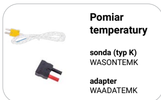
Pomiar temperatury sonda (typ K) WASONTEMK adapter WAADATEMK