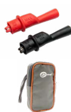
Krokodylek mini, 1 kV 10 A (kpl.) WAKROKPL10MINI Futerał S1 WAFUTS1